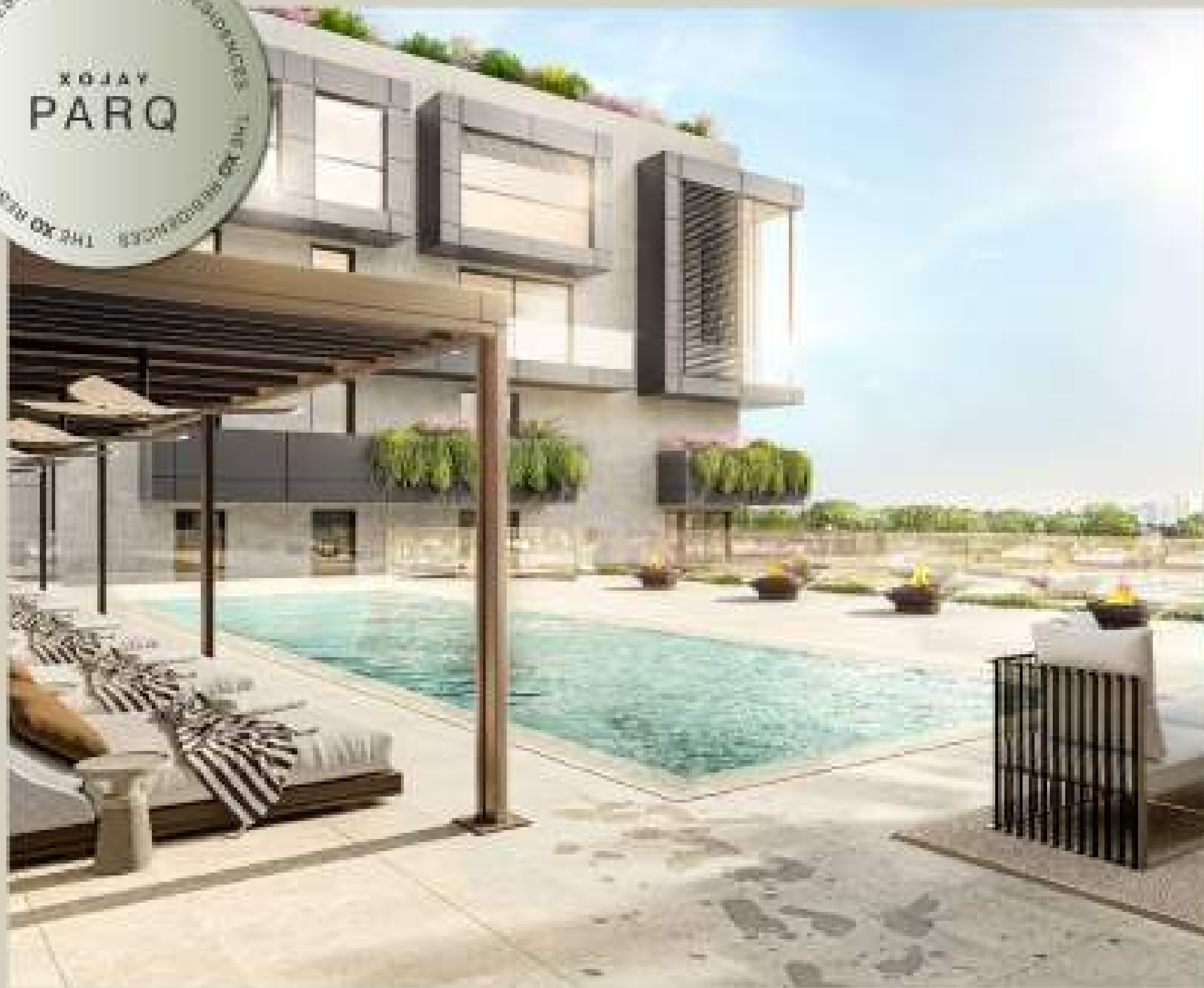
THE XO RESIDENCES