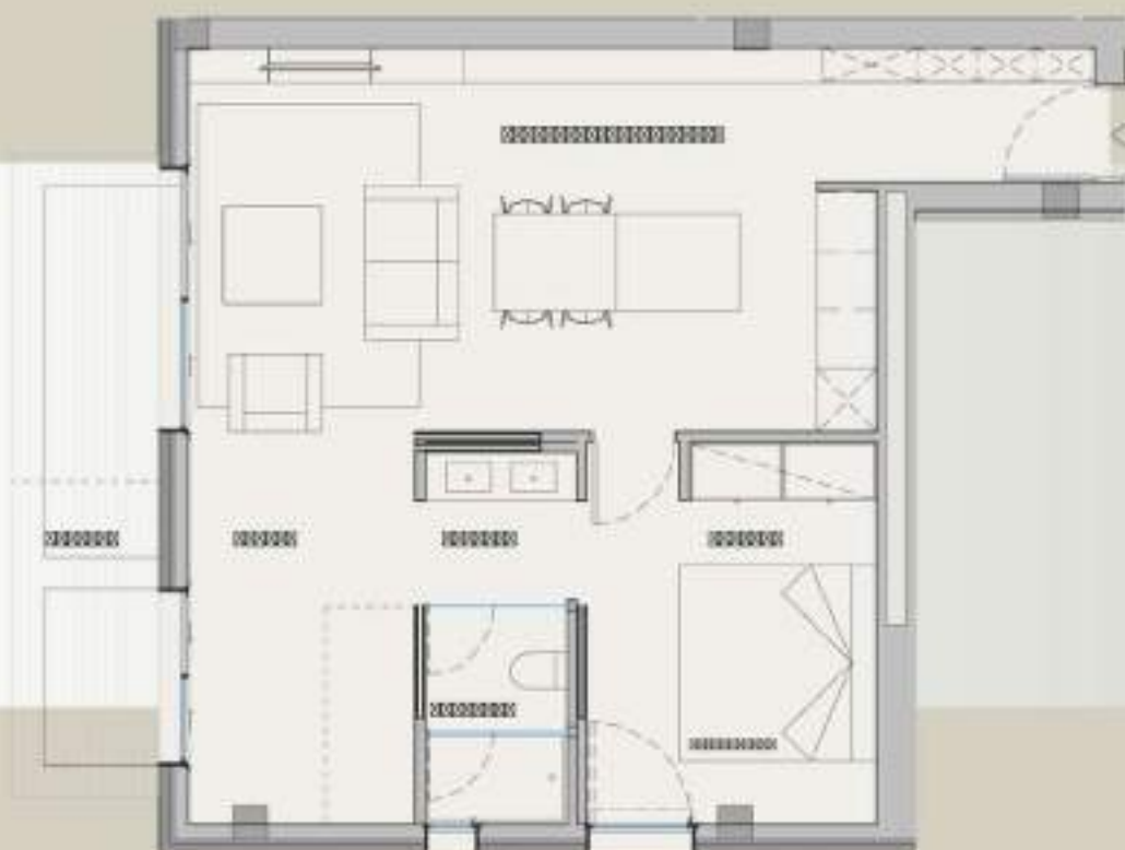
↓ APARTAMENTO 1 DORMITORIO + TERRAZA