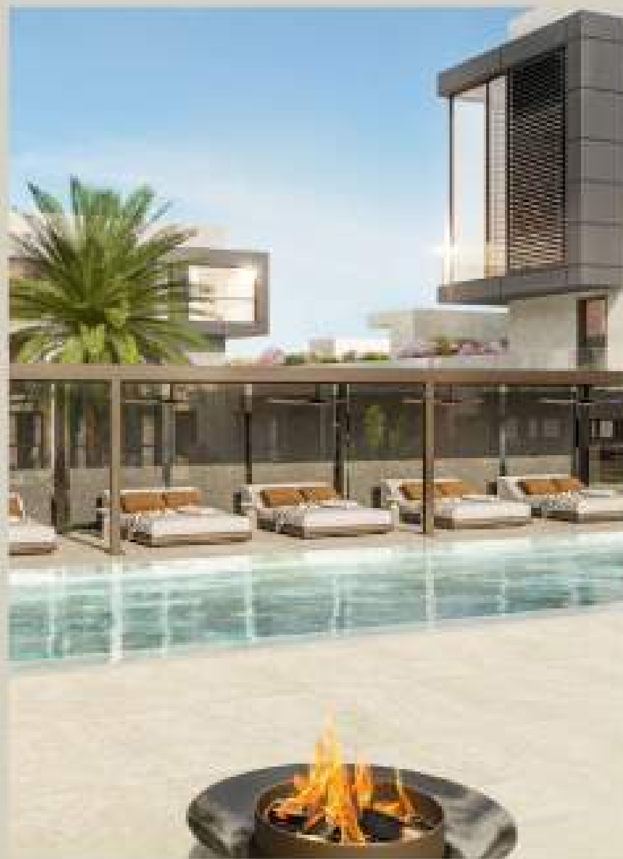
*LA REPRESENTACION RENDERIZADA PUEDE DIFERIR EN PEQUEÑOS DETALLES DEL RESULTADO FINAL