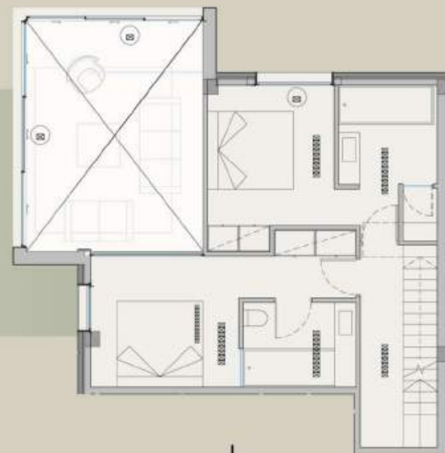
↓ ÁTICO 3 DORMITORIOS SOBRE 3 NIVELES + AZOTEA