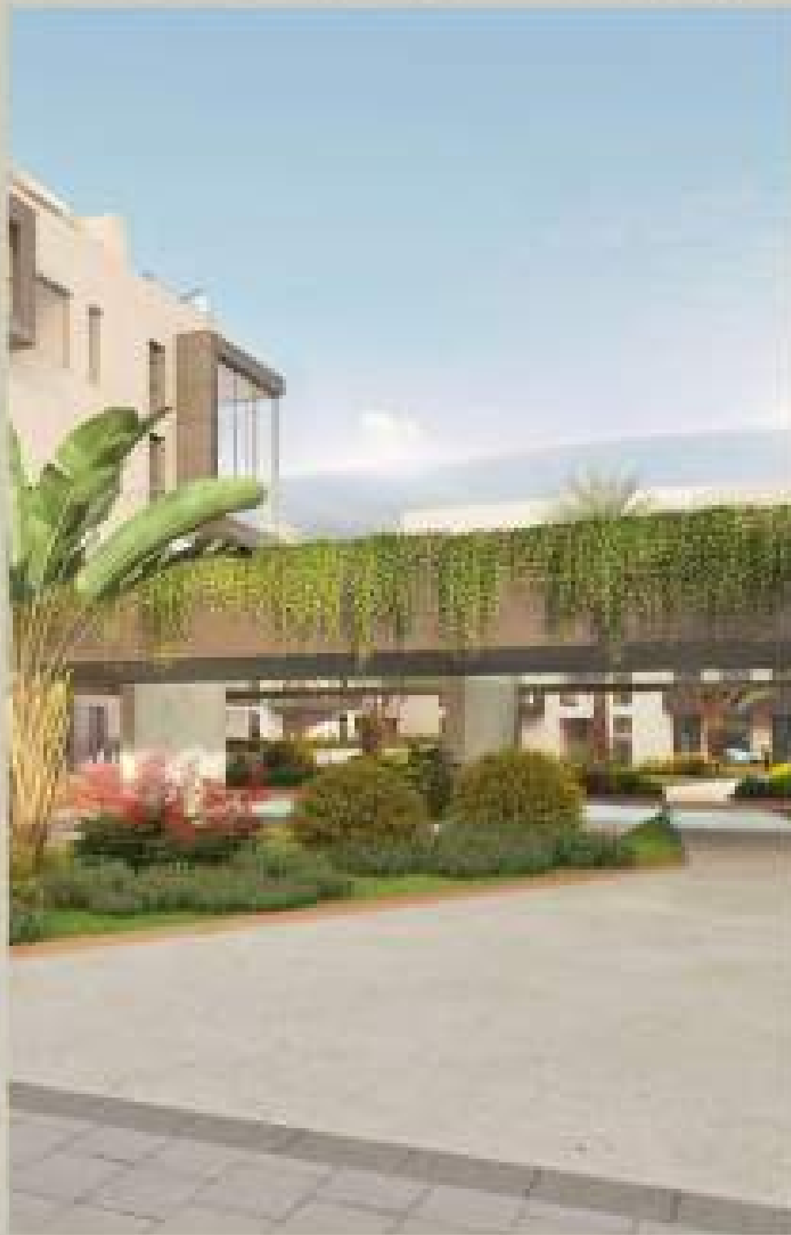
*LA REPRESENTACIÓN RENDERIZADA PUEDE DIFERIR EN PEQUEÑOS DETALLES DEL RESULTADO FINAL