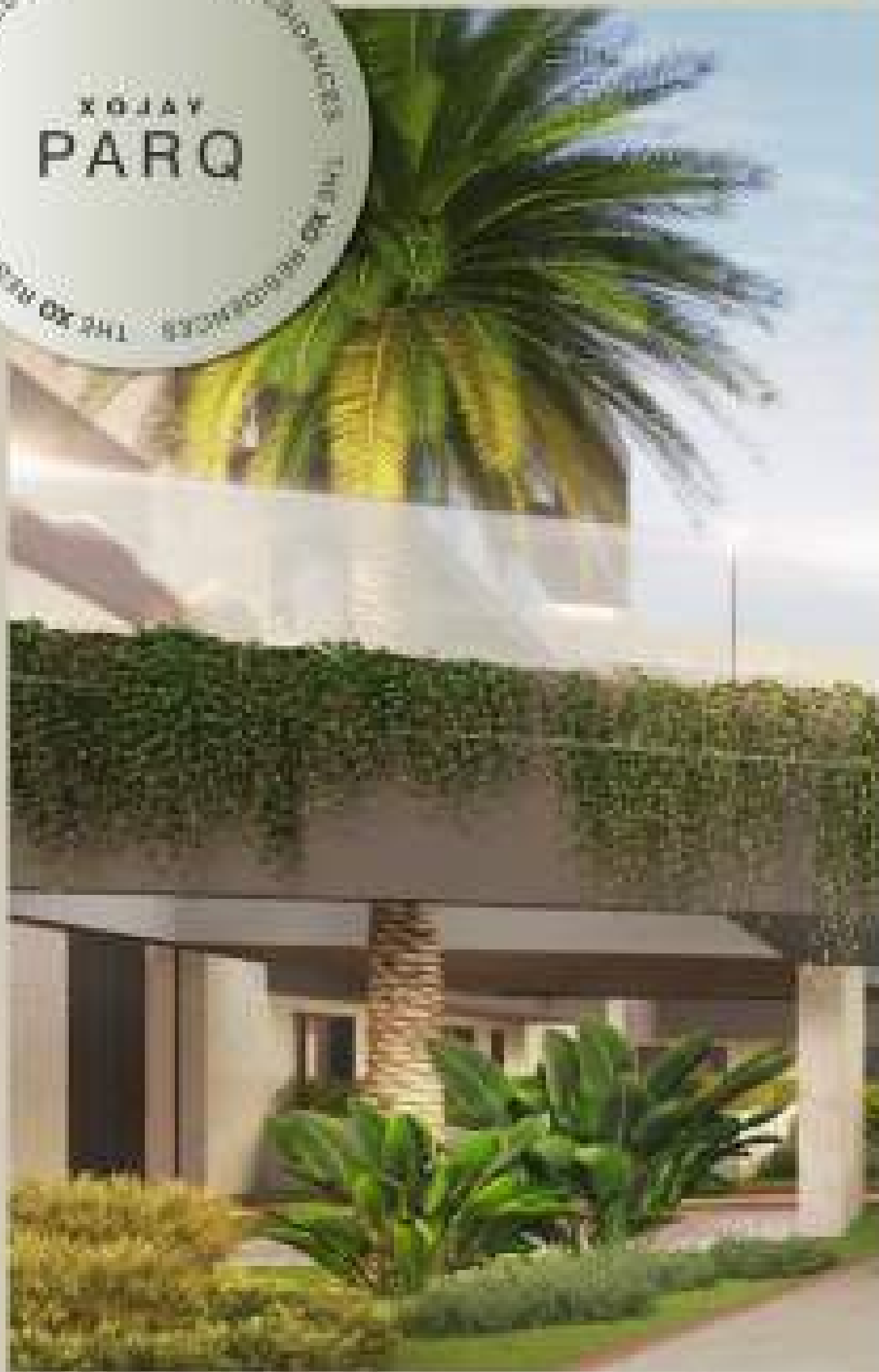
THE XO RESIDENCES